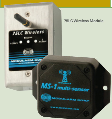
75LC Wireless Module

El completamente nuevo MS-1 multi-sensor es un módulo inalámbrico autónomo para monitorizar otros compartimentos y funciones en su entorno monitorizado, tales como refrigeradores de fácil acceso, refrigeradores para montar y más. Los tipos de sensores disponibles incluyen de temperatura, humedad, apertura de contactos (Ejemplo: Puerta Entreabierta) y cerrado de contactos (Ejemplo: Alarma de Pánico). La configuración del MS-1 sensor tiene selección de campos, para aceptar una amplia variedad, cantidad y tipo de sensores dependiendo de su aplicación (Ejemplo: Un MS-1 puede aceptar hasta 4 sensores de temperatura).